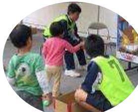
中学生ボランティア