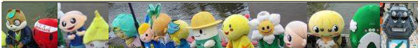
柴衛門狸・パパたこさん・おのゴロー・ラバちゃん・サラちゃん・ゆめるん・サンちゃん・西渡せい太君・アルファン・はばたん・水仙なんちゃん・ホッピー・あわじい・いぶし瓦の銀さん