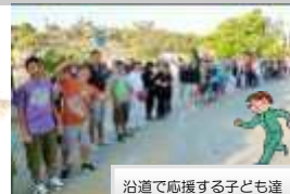
沿道で応援する子ども達

して2回目の参加が昨年。スタートから40kmあまりの地点で脱水状態になり、両足が痙攣して走れなくなってしまいました。その後は歩いたり、時々走ったりしながら102kmまで進みましたが、残念ながら関門時間が過ぎてリタイヤしました。