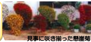
見事に咲き揃った懸崖菊

11月といえば各地域で文化展が開催されていますね。その会場の多くで色とりどりの見事な菊の鉢植えに出会えます。花はもちろんのことですが、いろいろな仕立て方で私たちの目を楽しませてくれます。