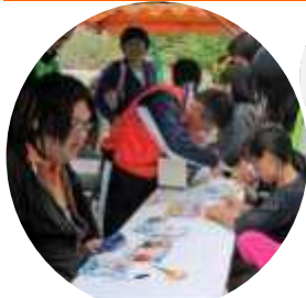
中・高・大学生がブース運営