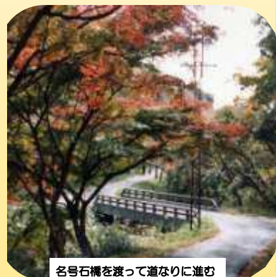
名号石橋を渡って道なりに進む