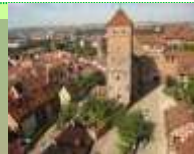
ニュルンベルク市街

ならび、氷点下の寒空のした、グリーンバイン(スパイス入りのホットワイン)を片手にクリスマス準備の買い物をする人たちでごった返します。お正月準備に活気付く師走の日本と通じ合うもの、ありませんか？ 寄稿 井高 志織 井高さん・・・仕事の関係で常にドイツと交流。「ドイツまでの距離は遠いですが、心は近い関係です」