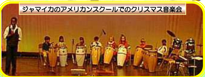
ジャマイカのアメリカンスクールでのクリスマス音楽会

が寄り、教会に行き、ターキーを焼いたりごちそうを食べたり、おしゃべりをして家族との時間を大切にします。日本のお正月と同じです。夜は、首都キングストン中心地の道路にお店や屋台が出て、駐車場やバーから、レゲエの爆音が鳴り響き、若者達は朝まで踊ります。クリスマスなのに熱い熱い国です。