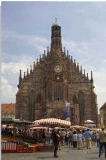
普段のマルクト広場。クリスマス時期には屋台のテントで埋め尽くされます。

ニュルンベルクはドイツの南に位置するバイエルン第2の都市で、町の北側にはかつての神聖ローマ皇帝の居城カイザーブルクがそびえ、城壁に囲まれた旧市街は石畳と赤茶色の屋根をした建物が立ち並ぶ、まるで絵本から飛び出したような町です。