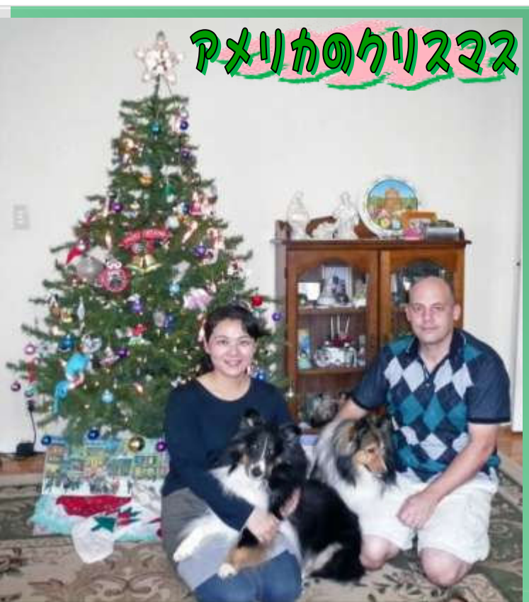
アメリカのクリスマス

ツリーだけでなく家じゅうにいろんな飾りつけをし、庭にはキリスト生誕時の馬小屋の様子を再現したようなセットをつくったり…。凝ってますよね。またお客様のために、た〜くさんのクッキーなどのお菓子を手作り！でも、日本のようなクリスマスケーキはないそうです。そして、家族や親せきが集まってローストチキンなどのごちそうを食べて盛大にお祝いします。日本のお正月のような感覚ですね。