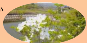
5月は花水木が見ごろ