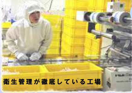
衛生管理が徹底している工場

淡路市尾崎の夕日を望む場所に立つクリーンな工場です。それは造られています。明治26年創業、年産2600万個の洗腸を製造する医薬品メーカー「ムネ製薬」。