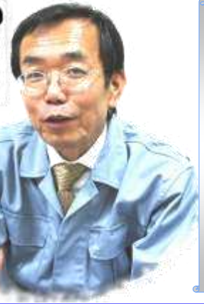
“ひとおし”について越く語る西岡社長