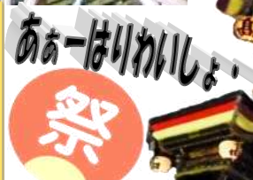
だんじりを上下・横倒し・回転させる