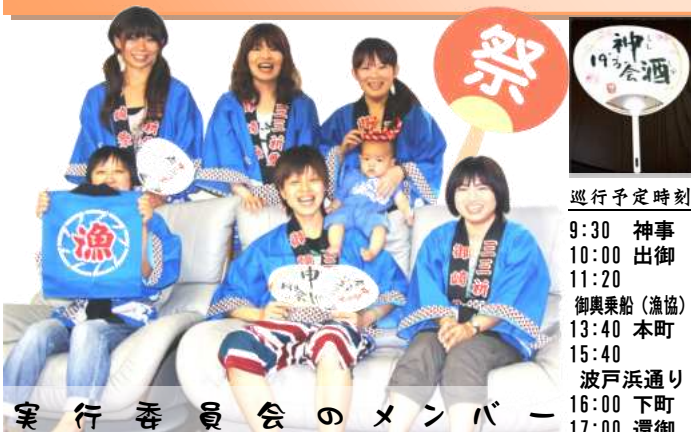
実行委員会のメンバー