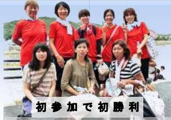
初参加で初勝利 レディミラクルのみなさん

レガッタは昨年に続き2回目で洲本市内三校の高校ボート部が出場し男女別にシングルスカル(一人漕ぎ)、ダブルスカル(二人漕ぎ)、クオドルプル(四人漕ぎ)のそれぞれの種目で潮橋と洲浜橋間の700mで対戦しました。