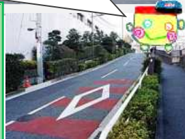
神田淡路町にある現在の淡路坂