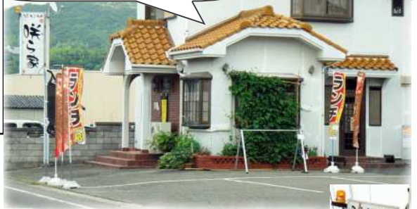
チャリダーの店「咲ら家」

チャリダーの店…自転車に関係がありそうですね。9月15日は、淡路島ロングライド。今年も淡路にたくさんの自転車愛好家が集まります。さっそく調べてみましょう。