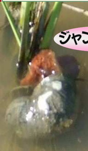
植えたばかりの稲を食べるタニシ