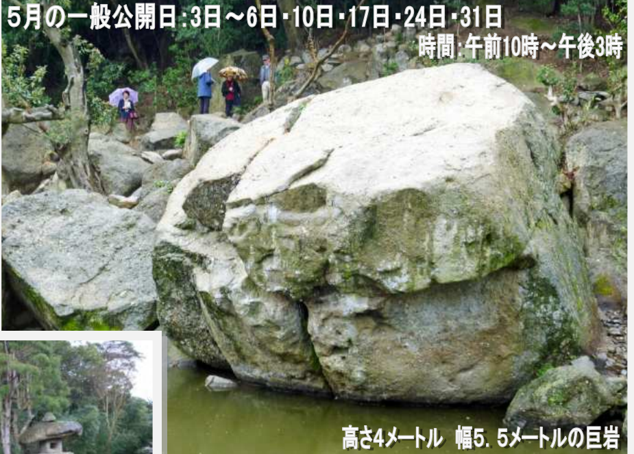
高さ4メートル 幅5.5メートルの巨岩