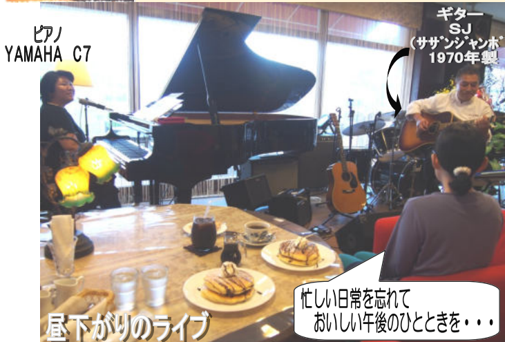
ピアノ YAMAHA C7