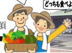
どっちも食べよかあ