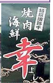
奥さん～泥落としランチ行くけ?

住所…〒656-1301 洲本市五色町都志168 電話…0799-33-0429 営業時間…11:30～15:00 17:00～22:00 定休日…火曜日