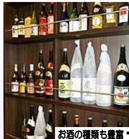
お酒の種類も豊富・

先ず目に飛び込んできたのはずらりと並んだお酒の瓶。料理に合せて何を飲もうかと考えるのも酒愛好家にはたまりません。