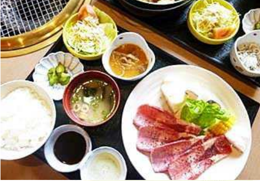
塩タン焼肉セット

農作業で疲れた体をスタミナ食で癒やしたい～、泥なんかどうでもええからパワーのつく美味しい