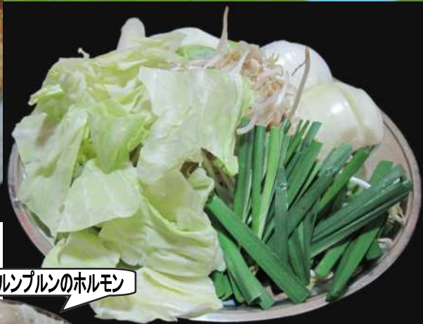
プルプルのホルモン