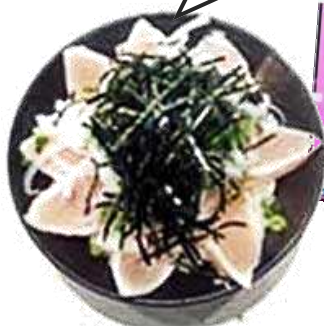
五色産のさわらのタタキ丼

さてこれで、泥落とし会本番のメニューが決まりそうです。ぜひ皆さんも淡路産のスタミナ食でパワーアップしませんか。(応援隊:瀬戸由美子)