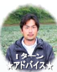
Iターン★アドバイス

北淡路ではIターンで、南淡路ではUターンで農業に取り組んでいる若者が少しずつ出てきているようですが、そんな若者へのアドバイスを伺うと、①地元での人脈作りをしっかりと行う、②農業のプロのもとで学ぶ(弟子入り)、③サポート制度を利用する、④資金の準備をしておく、等でした。