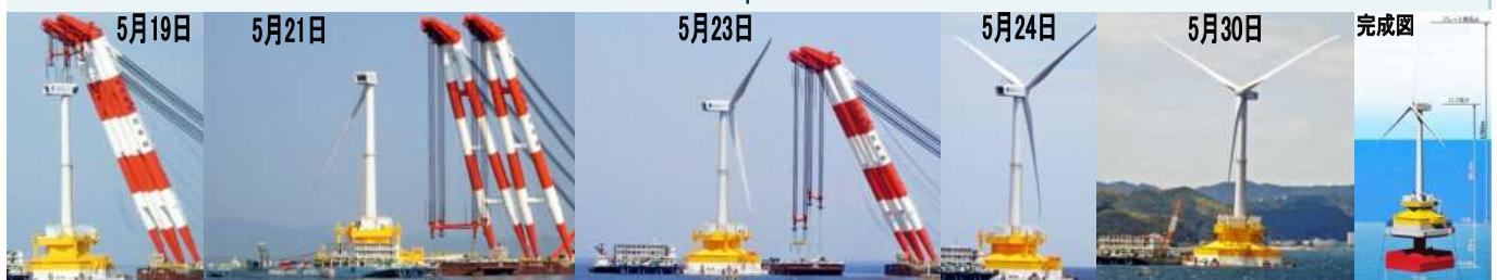
洲本港沖に現れてからほぼ完成するまでを写真で追いました。完成図などは洲本港岸壁に設置された「工事説明標示板」から引用しました。