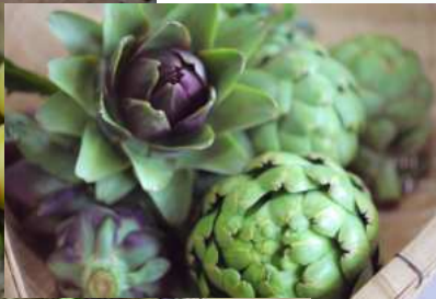
無農薬無化学肥料栽培と 自家採種そして踏み込み温床