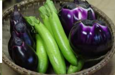
野菜の持つ本来の力を信じて 無農薬で安全な野菜を育てています。