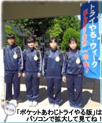
「ポケットあわじトライやる版」はパソコンで拡大して見てね!

淡路文化会館では淡路市立一宮中学校の2年生4名の女子生徒が体験をしました。たくさんの方々の利用の方々とふれあいにより、多くのことを感じ学ぶことができました。生活創造しんぶん「ポケットあわじ」づくりにもトライしました。これらの経験を今後の学生生活の中で、また将来に活かしてくれることと思います。(担当