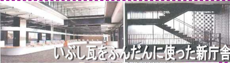
いぶし瓦をふんだんに使った新庁舎