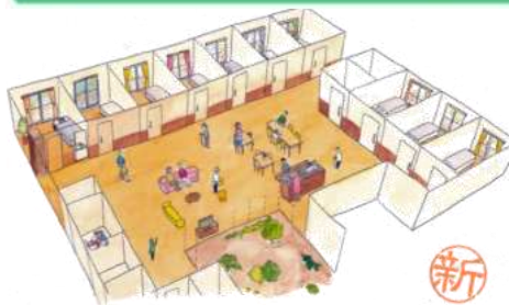
全室個室のユニット型特別養護老人ホーム