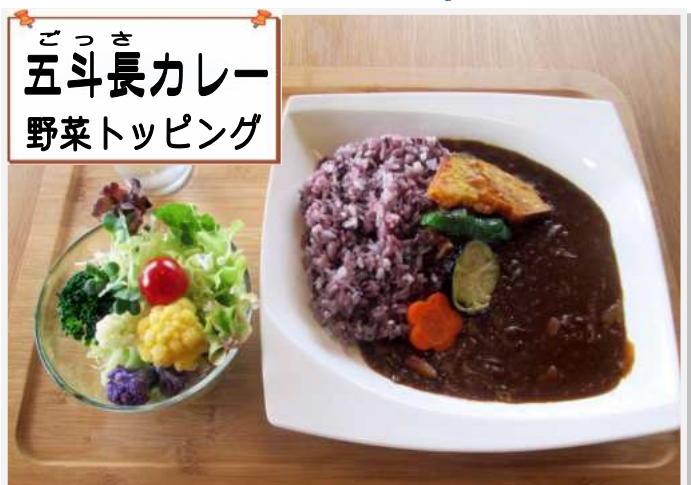
ごっさき 五斗長カレー 野菜トッピング

野菜キッシュは地元のキャベツ、カボチャ、ニンジン、椎茸、卵と調味料にチーズ、ベーコン等をまぜ合わせ、オーブンで加熱したものです。古代米・酢の物・筑前煮・サラダ・野菜ゴロゴロの味噌汁・漬物付きで800円です。