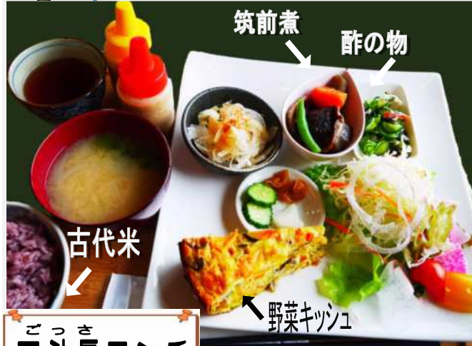
ごっさき 五斗長ランチ 野菜キッシュ

野菜キッシュは地元のキャベツ、カボチャ、ニンジン、椎茸、卵と調味料にチーズ、ベーコン等をまぜ合わせ、オーブンで加熱したものです。古代米・酢の物・筑前煮・サラダ・野菜ゴロゴロの味噌汁・漬物付きで800円です。