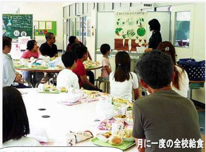
月に一度の全校給食