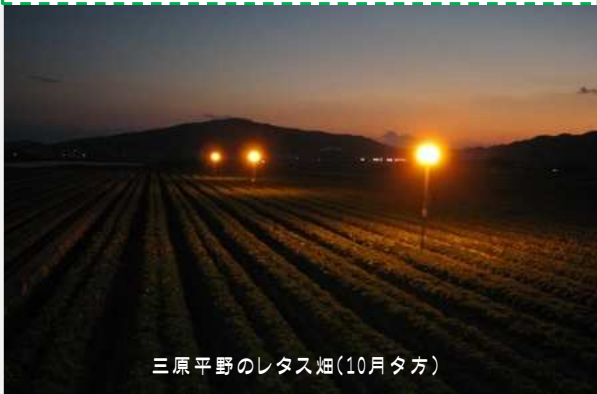
三原平野のレタス畑(10月夕方)

三原平野では、秋から冬には野菜がたくさん作られます。一面レタスの畑に黄色いボンボリのようなものが見えているのを見たことはありませんか(10月ぐらいから)。それは防虫のための高圧ナトリウムランプです。夜になると産卵にやってくるヤガ類の成虫が昼間と勘違いをしてやってきません。それで幼虫がついてない野菜として出荷できるのです。暗くなると、ライトアップがされ、レタス畑は幻想的なオレンジの光で照らされます。三原平野一帯に見られますが、特に阿万地区はたくさん見られます。