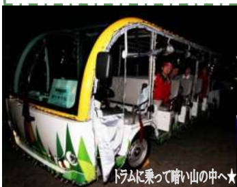
トラムに乗って暗い山の中へ★