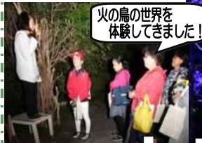
火の鳥の世界を体験してきました!

“自然”とマンガ・アニメ等の2次元コンテンツに“メディアアート”を融合させた体験型エンターテインメントテーマパーク。手塚治虫氏原作の「火の鳥」を題材に公園内の自然をプロジェクションマッピング等の技術によって光と音で演出された幻想的な森の世界を私たちも体験してきました。