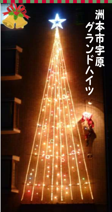
洲本市宇原 グランドハイッツ

夜、畑やビニールハウスが電気によって明るく浮かび上がっている風景をはじめると驚きとともに感動を覚えます。田園のイルミネーションと出会う夜のドライブはいかがでしょう。時期や地域が限定的なので、事前に各関係機関等から情報を得ておく必要があります。(応援隊:中田 浩嗣)