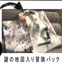
謎の地図入り冒険バック

淡路サービスエリアからハイウェイオアシスへ、そこで車を止めニジゲンノモリの入り口へ、そこからトラムに乗って暗い山の中へ、非日常感あふれる幻想的な世界の体験です。“特製の水、謎の地図、謎の地図を読み解くのに絶対必要な特別なライト”の入った冒険バックを持って、アジサイの谷から、約1.2kmつづく夜の森の中の光と音のショー「ナイトウォーク火の鳥」のスタートです。