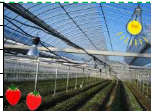
イチゴハウスの電照装置

夜、畑やビニールハウスが電気によって明るく浮かび上がっている風景をはじめると驚きとともに感動を覚えます。田園のイルミネーションと出会う夜のドライブはいかがでしょう。時期や地域が限定的なので、事前に各関係機関等から情報を得ておく必要があります。(応援隊:中田 浩嗣)