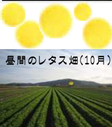
昼間のレタス畑(10月)

キクは、日照時間が短くなると花を咲かせるという性質があります。それを利用して、人工的に電球で照明をキクに当てて花を咲かせる時期を遅らせる電照菊の抑制栽培(=長日処理)が南あわじ市の灘地区を中心に行われています。かつては、たくさんのビニールハウスの光が闇に浮かび上がるような夜景が見られたそうです。現在では、その規模は小さくなっています。(※電照菊関係の写真は南淡路農業改良普及センター提供)