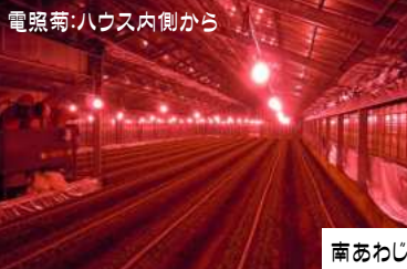
電照菊:ハウス内側から