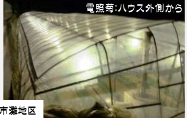
電照菊:ハウス外側から