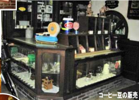
コーヒー豆の販売