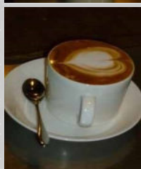
絵を描いていきます。