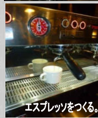
エスプレッソをつくる。