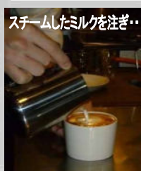
スチームしたミルクを注ぎ...