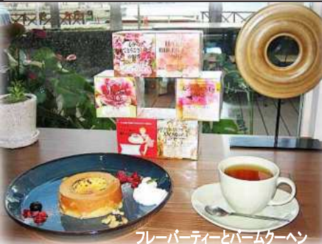
フレーバーティーとバームクーヘン