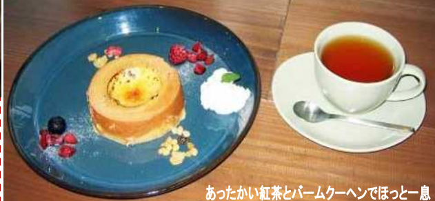
あったかい紅茶とバームクーヘンでほっと一息