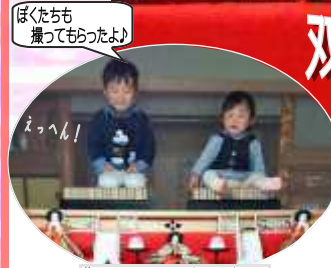
ぼくたちも撮ってもらったよ!