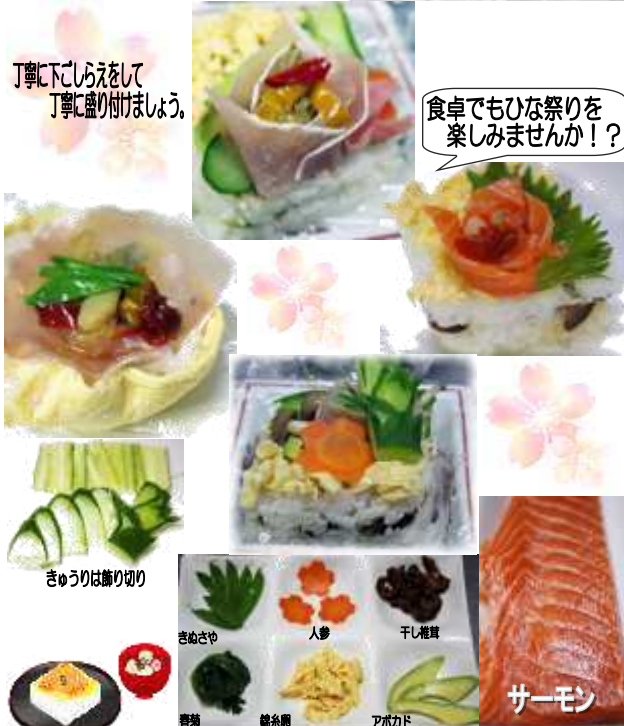
きゅうりは飾り切り