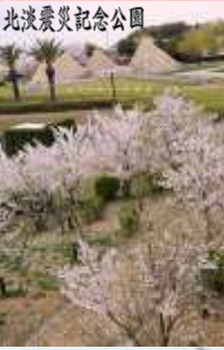
北淡震災記念公園

阪神・淡路大震災で犠牲になられた方々のご冥福を祈って10年の節目の平成17年1月に植栽し「さくら公園」と名づけました。20年目の追悼式典で遺族代表の方が述べられた「忘れないてください。人は人と助け合いながら生きていくことを！」の言葉に桜の木々も感動し、毎年みごとな花を咲かせ、見学に訪れる人々に「生きることの大切さ」を考える機会を与えてくれています。