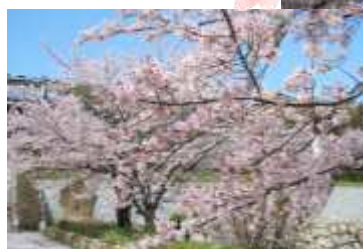
洲本市五色町鮎原葛尾555

県道466号線を洲本市五色町鮎原吉田あたりを北へ折れ、標識に沿って走るとすぐ着きます。高野山真言宗のお寺。毎年4月16日に大祭があり、ご本尊(大聖不動明王)のご開帳があります。駐車場から参道への桜がとてもきれいです。知る人ぞ知る桜の見所です。境内ではもみじも楽しめます。