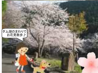
ダム湖のまわりでお花見散歩♪