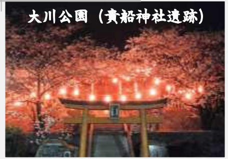
大川公園 (貴船神社遺跡)

阪神・淡路大震災で以前からあった富島八十八か所がお参りできなくなり、簡保センター上の現在の場所に有志の人が力をあわせて移転。皆さんの心のよりどころができ桜の花もあざやかに咲き誇っています。