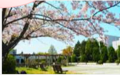
淡路文化会館の桜

淡路文化会館への上り坂に桜並木が連なっています。満開の時はもちろん、散り始めると、ピンクのじゅうたんの道を走っているようで感動です。坂を上りつめると、大きな1本の桜の木がお迎えします。隣接する香りの公園の斜面に咲き誇る桜は、散策道を歩くと目の前で桜を感じることが出来ます。(淡路文化会館:安井 由美)