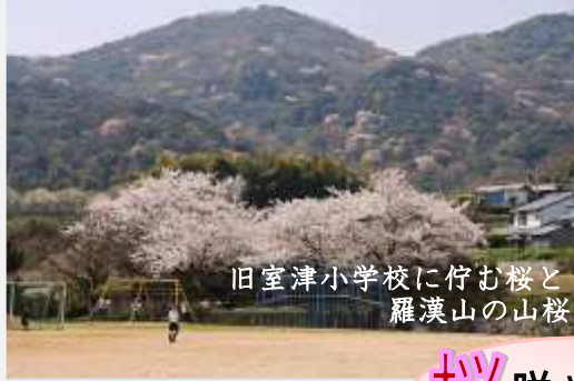
旧室津小学校に佇む桜と羅漢山の山桜

さんも、身近な桜の見所で桜を愛で、淡路島の新鮮な旬の味を堪能してみませんか。なお、草木の葉が紅葉する晩秋には、春の桜鯛より鱗が赤みが強く脂のりもよくなり『紅葉鯛』として珍重されます。真鯛には旬が二度あるのですね。(応援隊:中田 浩嗣)