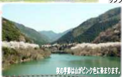
桜の季節は山がピンク色に染まります。