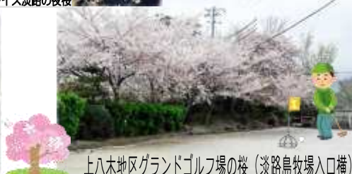
上八木地区グランドゴルフ場の桜 (淡路島牧場入口横)