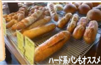
ハード系パンもオススメ