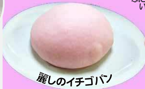
麗しのイチゴパン