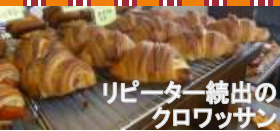
リピーター続出の クロワッサン

フーランジェリーコパンじとほ 南あわじ市神代地頭方943-4 電話 0799-42-7203 営業時間/10:00~19:00 定休日/水曜日 第2・4日曜日