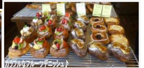
カラフルなフルーツデニッシュ