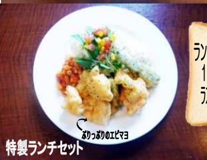
特製ランチセット