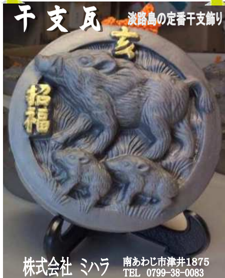
干支瓦 淡路島の定番干支飾り