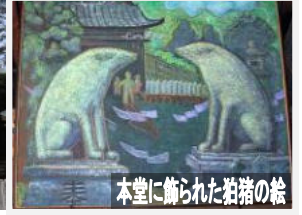
本堂に飾られた猪猪の絵