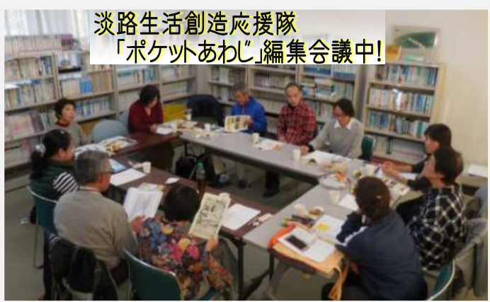
淡路生活創造応援隊 「ポケットあわじ」編集会議中!