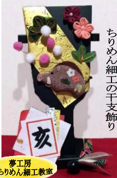
ちりめん細工の干支飾り