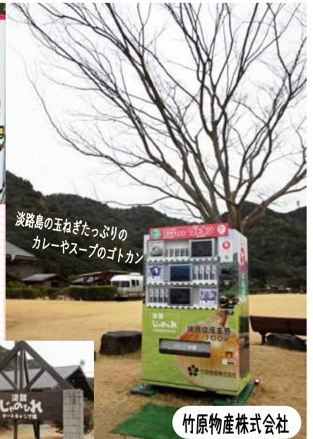
淡路島の玉ねぎたっぷりのカレーやスープのゴトカン