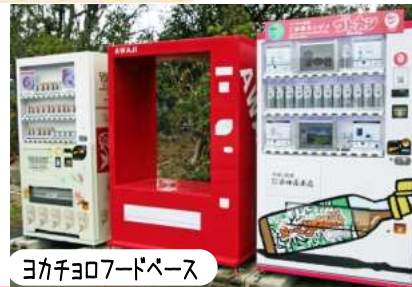
ヨカチヨロフードベース