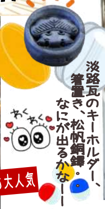
淡路瓦のキーホルダー、箸置き、松帆銅鐻、なにか出るかなー