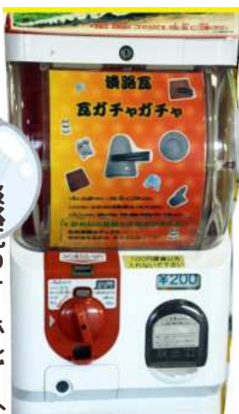
淡路島かわらや TEL 0799-36-2303