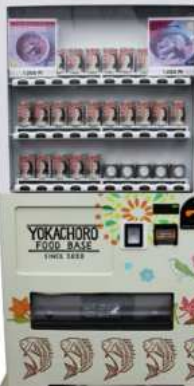
天然真鯛のレッドカレー