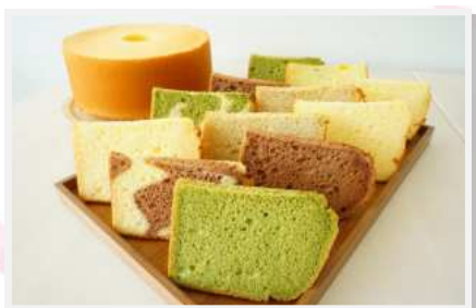
ケーキの種類は35種類