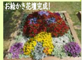
お絵かき花壇完成!