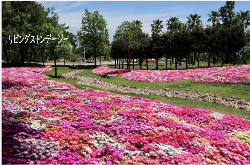
リビングストーンジー