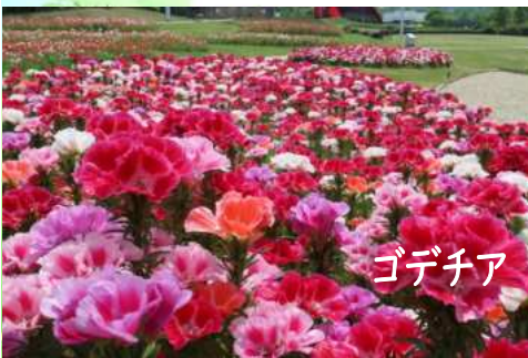
ゴデチア 大地の虹北花壇