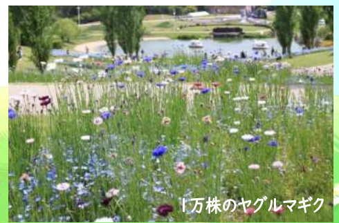
「万株のヤグルマギク

国営明石海峡公園は、「春のカーニバル」の真っ最中で、体験イベントが目白押しです。5/15(日)までの期間中の土日祝にはクラフト体験があり、5/3(火祝)には植木鉢にアクリル絵の具で好きな絵を描く「ペイント体験」があります。