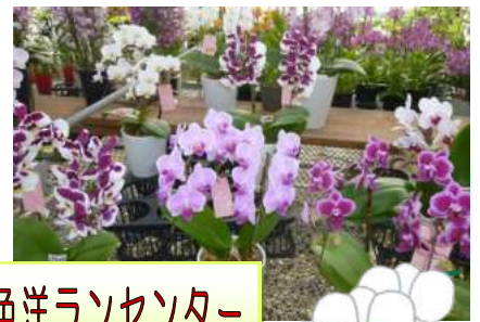
ウェルネスパーク五色 五色洋ランセンター