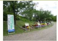
お絵かき花壇づくり コンテスト作品展示中