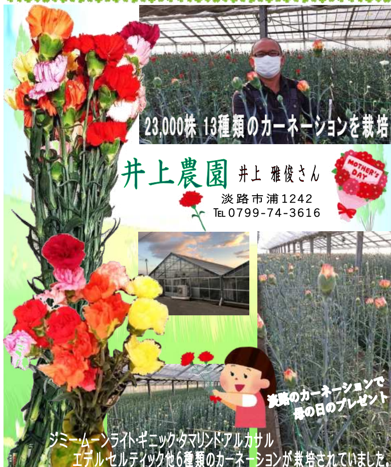
23,000株 13種類のカーネーションを栽培