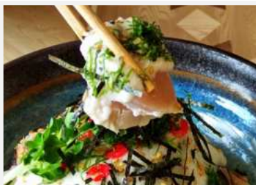
お多福名物 さわら炙り山かけ丼