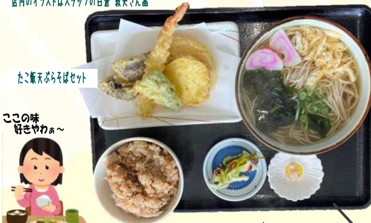
たこ飯ぶらそばセット