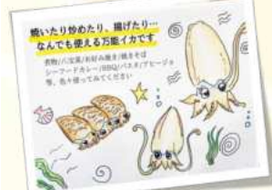
店内のイラストはスタッフの白倉 敦史さん画