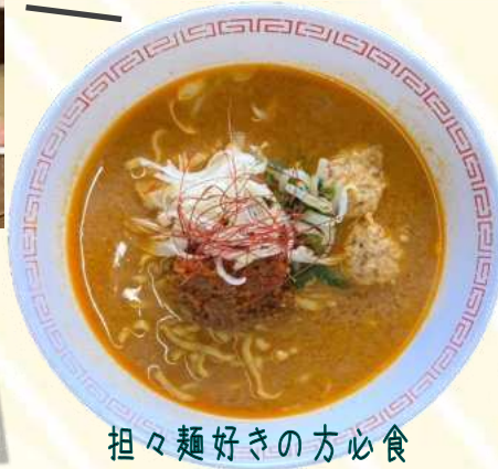
担々麺好きの方必食