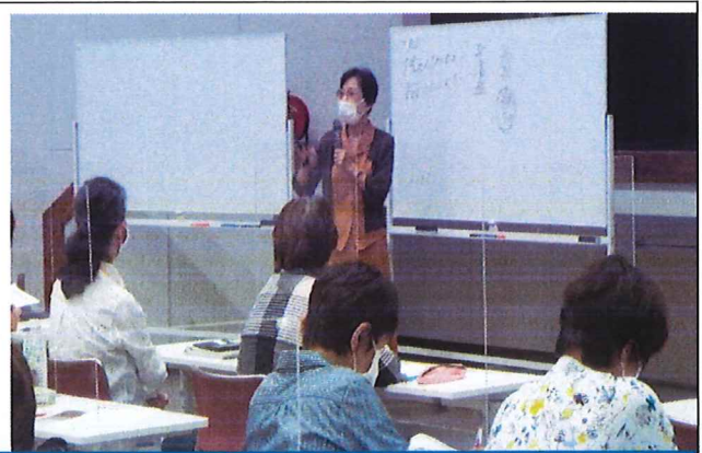
9/14 サークル鳥4 ふるさと学・民踊・美術・園芸