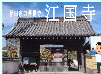
稲田家の菩提寺 江国寺