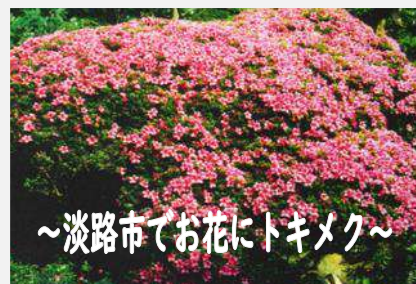
～淡路市でお花にトキメク～

P1 トキメキスポット P2 花めぐり P3 西海岸夕日めぐり P4 洲本歴史めぐり P5 大盛りめぐり P6 淡路文化会館・兵庫県淡路県民局・淡路島くうみ協会からのお知らせ P7.8 淡路の文化活動・イベント情報