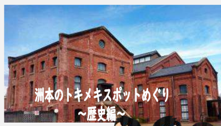
洲本のトキメキスポットめぐり ～歴史編～