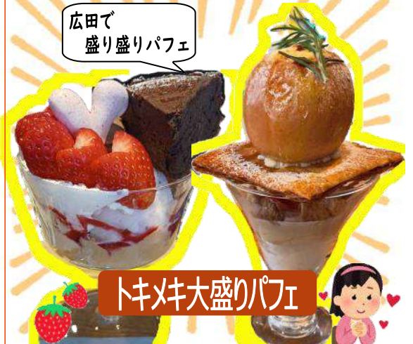
トキメキ大盛りパフェ