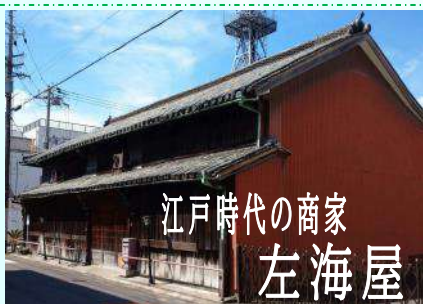
江戸時代の商家 左海屋

町の中には江戸時代の町名や地名が書かれた石柱が多くみられます。洲本八幡神社内に江戸時代の建物「金天閣」があります。また江戸時代の商家「左海屋」の建物も残っています。巨石を用いた庭園は徳島藩筆頭家老稲田氏の学問所「益習館」の見事な庭園です。その稲田家の菩提寺「江国寺」には稲田家代々の墓所があります。