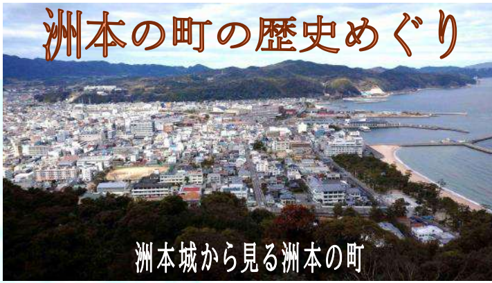
洲本城から見る洲本の町

今なお城下町のおもかげを残す洲本の町並み、そんな町の歴史を感じるところを歩いてみました。まずは何といても「洲本城跡」でしょう。築城当時の多くの石垣が残っています。城跡から見る町並みも見応えがあります。