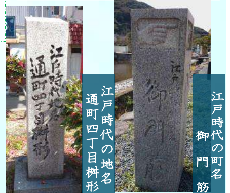
江戸時代の地名 通町四丁目辨形