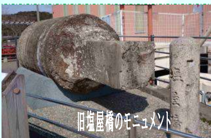
旧塩屋橋のモニュメント