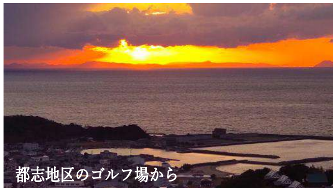
都志地区のゴルフ場から

【多賀の浜】 約1.5kmにわたるビーチと広い芝生エリアがある。周りに遮るものは何もなく、夕陽の光が海の上で一直線に輝く光景を楽しむことができる。 (淡路市多賀2476-3 駐車場あり)