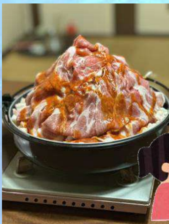
～映える大盛りにトキメク～