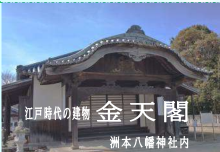
江戸時代の建物 金天閣 洲本八幡神社内