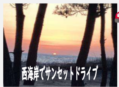
西海岸でサンセットドライブ