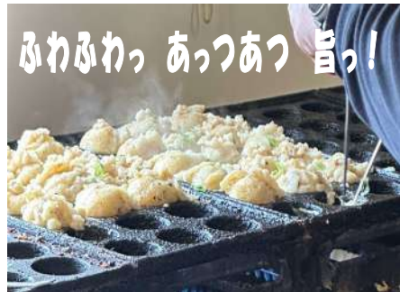
鉄板を囲んで、昭和トークに花が咲く