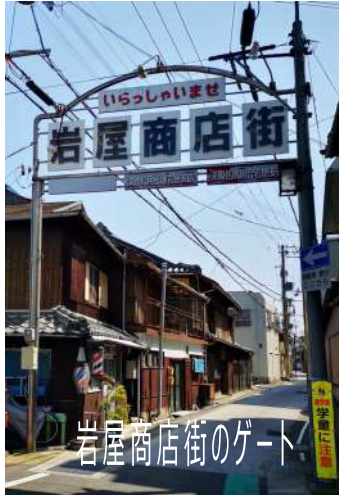
岩屋商店街のゲート

道の駅あわじで橋のモニュメントを見たあと、タコスで腹ごしらえしたら、魅力たっぷりの岩屋レトロエリアへGO!