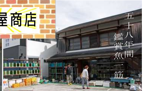
五十八年間 鑑賞魚一筋

南あわじ市市福永354-1 【電話】0799-42-0094 【営業時間】9:00~20:00