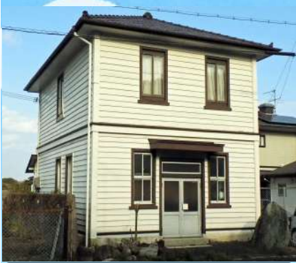
旧塩田郵便局 昭和12年建築