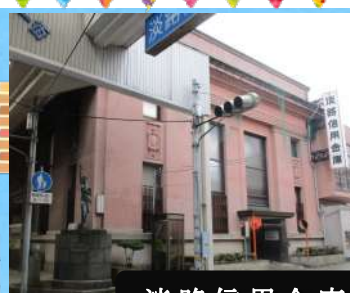
淡路信用金庫 本町支店 昭和10年建築