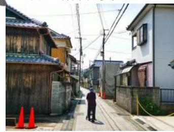
岩屋観音寺参道へ