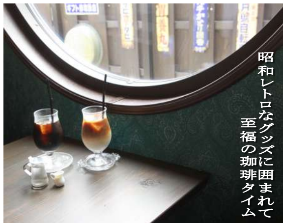
昭和レトロなグッズに 囲まれて 至福の珈琲タイム