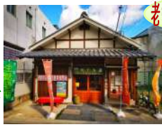
老舗の和菓子屋さん