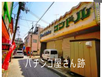
パチンコ屋さん跡