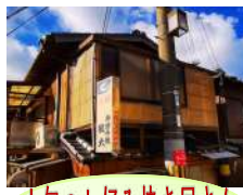
人気のお好み焼き屋さん