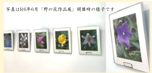
写真はR6年6月「野の花作品展」開催時の様子です

池の上に佇む美術展示室と県民ギャラリーでは、1年を通して様々な美術展示企画を開催します。2024年美術展示年間カレンダーは淡路文化会館のホームページをご確認ください。