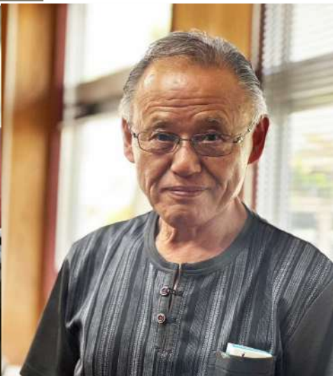
迫力ある鬼瓦を伝統の技でつくり出す職人