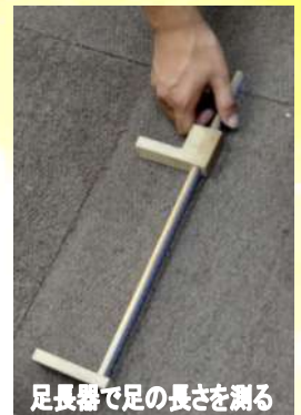
足長器で足の長さを測る