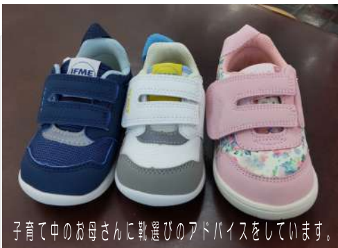
子育て中のお母さんに靴選びのアドバイスをしています。