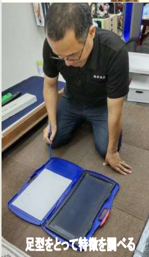
足型をとって特徴を調べる