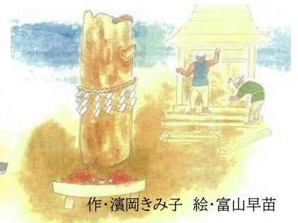
作・濱岡きみ子 絵・富山早苗